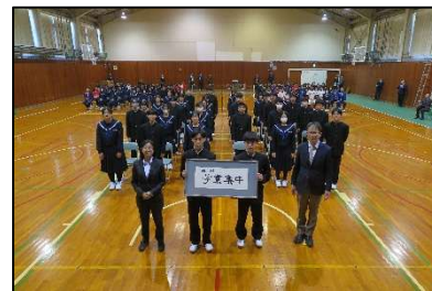
対面式後 校訓とともに